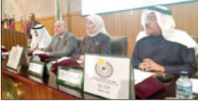
أكد الدكتور الشيخ خالد بن خليفة بن خليفة نائب رئيس مجلس الأمناء العام لثقافة البحرين، في كلمته التي ألقى خلالها في ملتقى الثقافة المدنية، التي تنظمها مؤسسة البحرين المدنية، في الكويت. وقال سموه: «الثقافة المدنية قامت على التعددية والتنوع وروح التسامح والتعايش السلمي». وأضاف سموه: «الثقافة المدنية قامت على التعددية والتنوع وروح التسامح والتعايش السلمي». وأضاف سموه: «الثقافة المدنية قامت على التعددية والتنوع وروح التسامح والتعايش السلمي».