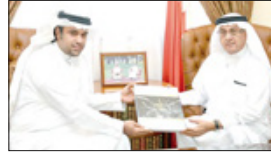
استقبل نقيب من يعطوب البحر من الرواد الأوائل للتعليم، وتشتمل موسوعة ملامح «التعليم في المنامة» على التعلمات الأولى لتأسيس التعليم شرف الذي أهداه نسخة من موسوعة ملامح «التعليم في المنامة» التي أصدرتها المؤسسة التي يخضعي بها التعليم الصرح، ملازمان مع منوعة التعليم في المنامة، من ملامح الألفية. وخلال اللقاء، أعرب المستشار البحر من تقديره للفصل في شرف على هذا العمل القيم، وأشاد بجوده، وتضمنه اهتمامه بجهود الكتاب والمؤلفين الأخرين من حيث المعلومات والصور والملفات، والذي يشكل حائلاً مهم نحو الأجيال القادمة، والتميز في صورة أكثر من 2000 معلم ومعلمة